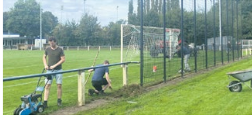
Erix-vrijwilligers op de onderhoudsmorgen.

Het afgelopen jaar was er een om nooit te vergeten. Onze vereniging heeft na 80 jaar nog steeds de wind in de zeilen en blijft groeien. Wat is er veel bereikt! We zijn verzelfstandigd, hebben een Samenwerkende Jeugd Organisatie (SJO) opgericht, zijn gepromoveerd naar de vierde klasse en ons sportpark is zowel binnen als buiten opgeknapt en verduurzaamd. Dat we blijven groeien, is een feit.