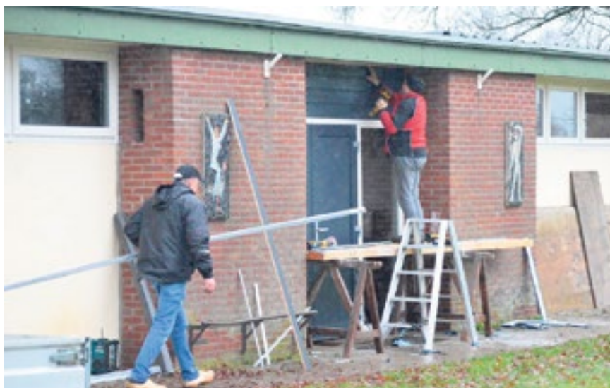
Het clubgebouw wordt opgeknapt.

Het eerste elftal van VIOS Beltrum gaat volgend seizoen getraind en gecoacht worden door Ferhat Ozerdogan en Eddie Tolcamp, zo maakten wij al bekend in januari.